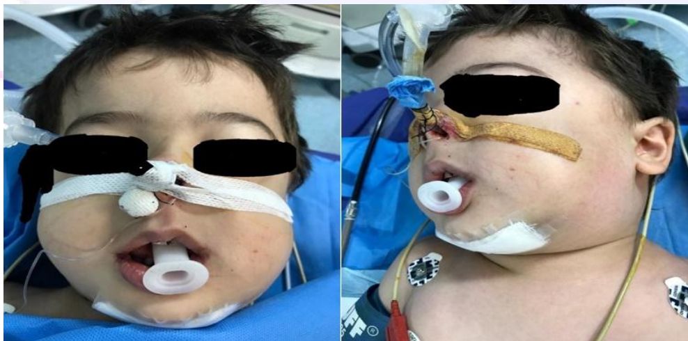
شکل ۴: تورم دوطرفه صورت و گردن از ناحیه تمپورال تا سوپراکلاویکل

شکل ۳: درمان شکستگی شکستگی های کنديل سمت چپ و سمفیز منديبل با استفاده از تکنیک Essing Wiring پارگی داخل دهانی با نخ ویکریل ۰/۴ و زیر چانه با نخ نایلون ۰/۵ سوچور گردید و جهت درمان شکستگی کنديل تصمیم به