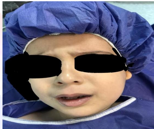
شکل ۱: بیمار قبل از انجام پروسیجرهای جراحی

معرفی مورد: یک پسر بچه سالم ۴ ساله که بعلت تروما به دنبال سقوط از ارتفاع حین بازی کردن دچار شکستگی های کندیل سمت چپ و سمفیز مندیبل شده بود و به جهت درمان شکستگی ها در بیمارستان مرکز طبی کودکان (دانشگاه علوم پزشکی تهران) بستری شده بود.