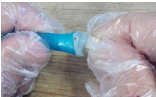
شکل ۳: نمونه دندانی اتصال یافته به سرسمپلر.

ناحیه فورکا داخل این دهانه فرو برده شد. برای اطمینان از عدم نشت میکروبی از محل اتصال سرسمپلر با دندان، چسب تا یک میلی متر اپیکالی تر از ناحیه CEJ قرار گرفت (شکل ۳). گروه کنترل نیز بدون اینکه در ناحیه فورکای آن ترمیمی انجام شود، به همین صورت چسبانده شد و در کنار سایر نمونه های آماده سازی شده قرار گرفت.