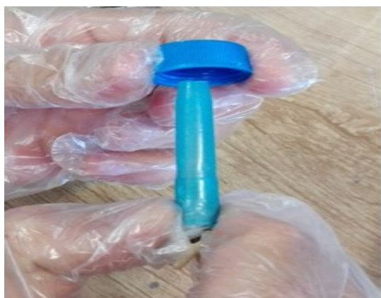
شکل ۴: متصل کردن مجموعه سرسمپلر و نمونه دندانی به دهانه لوله سانتریفیوژ.

سپس قسمت مرکزی درب های پلاستیکی لوله های سانتریفیوژ قابل اتوکلاو، به تناسب قطر دهانه باریکتر سرسمپلر سوراخ و سرسمپلر به گونه ای که دهانه آن اندکی بیرون آمده باشد با چسب ثابت گردید (شکل ۴).