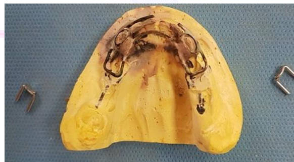
در مرحله بعد دیستال شو gerber مطابق شکل به لینگوال ارچ اصلاح شده لحیم شد. (شکل ۷)