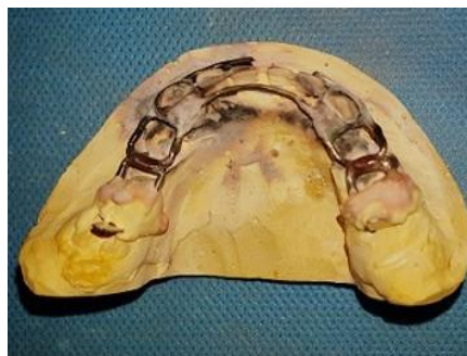
در نهایت اپلاینس پالیش شد. (شکل ۷).