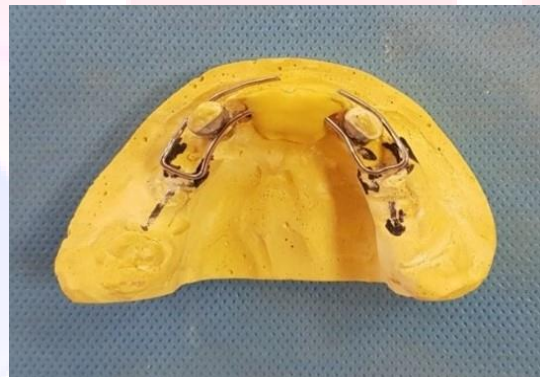
و بعد به بندهای کانین لحیم شد. (شکل ۵)