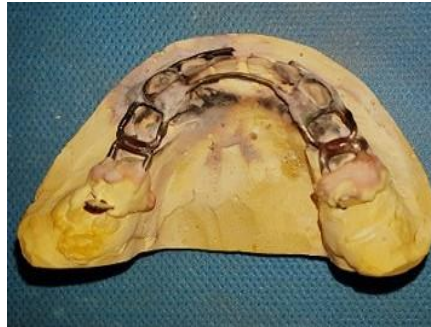
در نهایت اپلاینس پالیش شد. (شکل ۷).