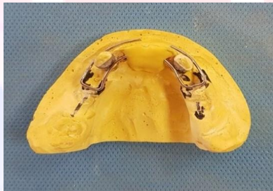
و بعد به بندهای کانین لحیم شد. (شکل ۵)