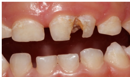
شکل ۲: نمای دندان پوسیده (فیوژن) قبل از درمان