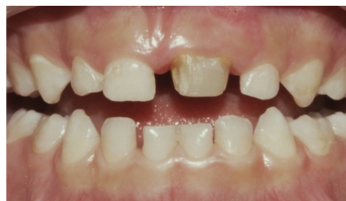
شکل ۵ الف: دندان فیوز شده بعد از ترمیم