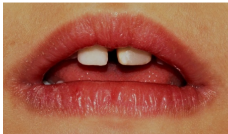
شکل ۶: نمای بیمار در فالوآپ ۳ ماهه