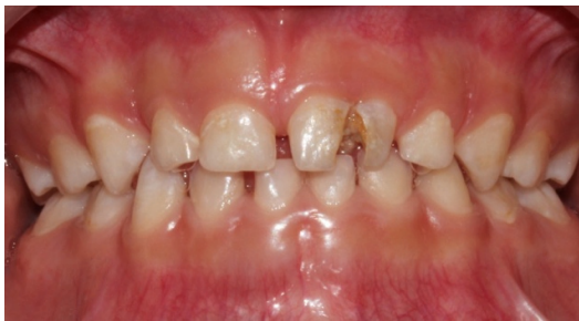
شکل ۱: نمای دهان بیمار از روبرو قبل از درمان

نشان می داد (شکل ۳) و با توجه به آنکه تعداد دندانهای بیمار نرمال بود تشخیص فیوژن دندان A با یک دندان اضافه داده شد. پس از توضیح درمان به والدین با توجه به همکاری ضعیف کودک، در جلسه ی اول درمان تنها برساز انجام شد تا همکاری او جلب شود. در جلسه ی دوم، پس از تزریق بی حسی، با حذف پوسیدگی ها و مشاهده ی اکسپوژر پالپی، پالپکتومی انجام شد. کانالهای دندان فیوژ شده به وسیله ی لنتولو با زینک اکساید اورژنول پر (شکل ۴) و برس مدخل کانالها سمان زینک فسفات گذاشته شد و نهایتاً با سیستم total etch/wet bonding کامپوزیت (Z250/3M) ترمیم تاجی دندان صورت گرفت (شکل ۵ الف و ب). برای کاهش بعد مزیدیستال دندان فیوز شده مزیال و دیستال دندان توسط فرز بلند الماسی تیپر (SS White) shave (استریپ)، تالون کاسپ برداشته شد و نهایتاً ترمیم کامپوزیت پرداخت شد. در فالوآپ یک ماهه دندان بدون علامت، در تست دق نرمال، بدون سینوس ترکت و ادم بود. همچنین در فالوآپ ۳ ماهه مشکلی وجود نداشت (شکل ۶).