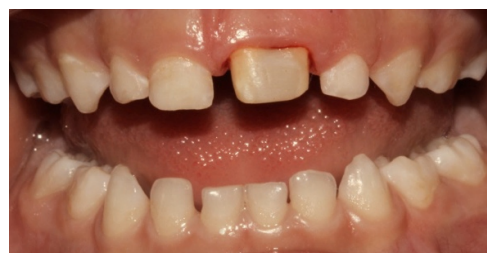
شکل ۵ ب: دندان فیوز ترمیم شده بعد از پرداخت